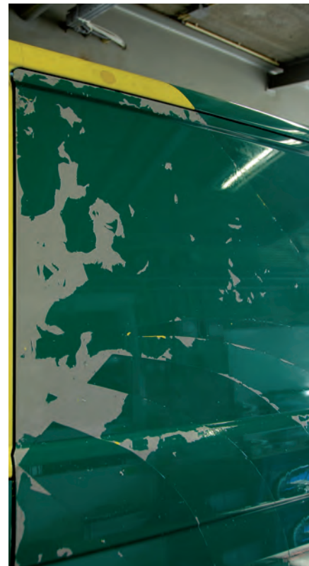
Uren peuteren aan afbrokkelende folie.