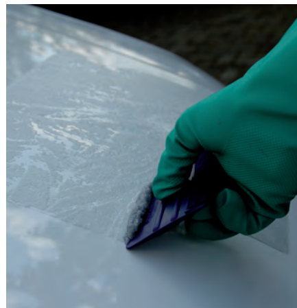
Juiste lijmverwijderingstechniek bespaart tijd.