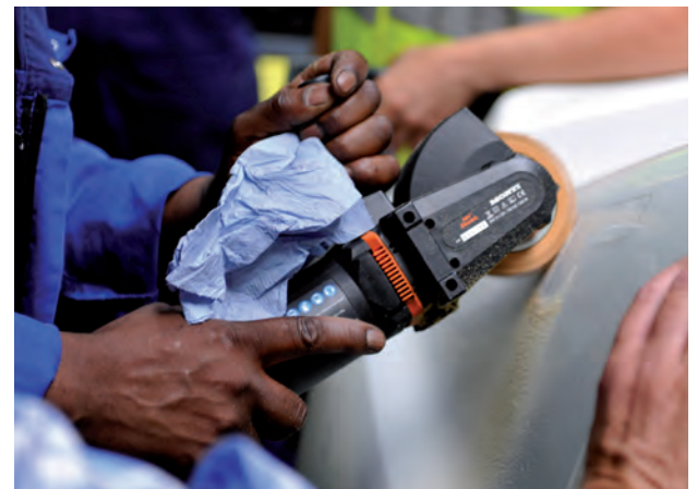
Met een vinylzapper verwijder je klein tekstwerk.