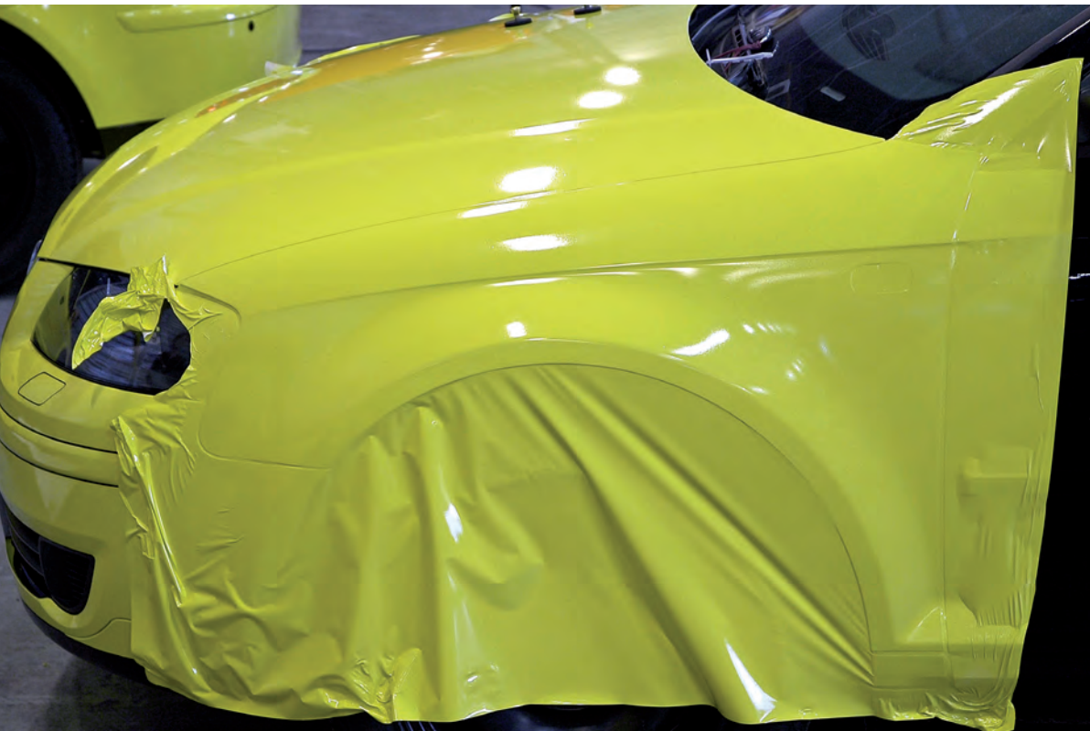
Leuk hoor zo'n gifgele auto, maar gelukkig kan het er ook weer af.

Omdat er veel verschillende soorten folies en ondergronden zijn, is er niet één ideale manier van demonteren. Groot project